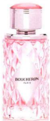
► Boucheron Place Vendôme. 100 ml. 82,50 €