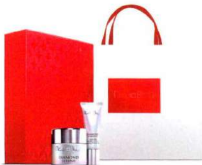
► Set Diamond Extreme Collection de Natura Bissé. Tratamiento facial y contorno de ojos. 232 € (regalo valorado en 149 €)