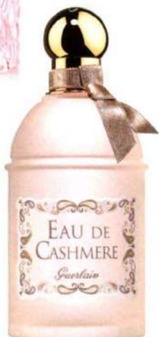
► Eau de Cashmere de Guerlain. 125 ml. 72 €