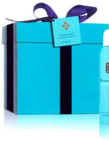
► Hammam Collection de Rituals. Espuma de ducha, exfo- liante corporal, mascarilla exfo- liante corporal y minibarritas aromáticas de hogar. 38,50 €