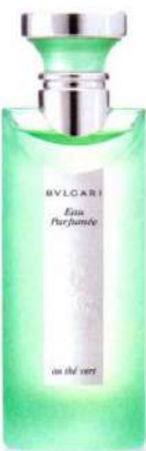
► Bulgari Eau Parfumée au Thé Vert. 72 €