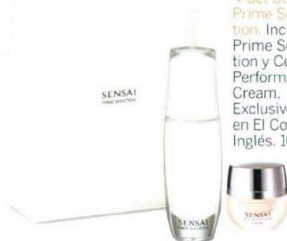
► Set Sensai Prime Solu- tion. Incluye Prime Solu- tion y Cellular Performance Cream. Exclusivo en El Corte Inglés. 160 €