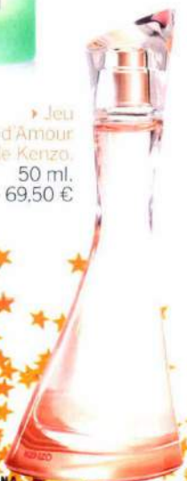
► Jeu d'Amour de Kenzo. 50 ml. 69,50 €